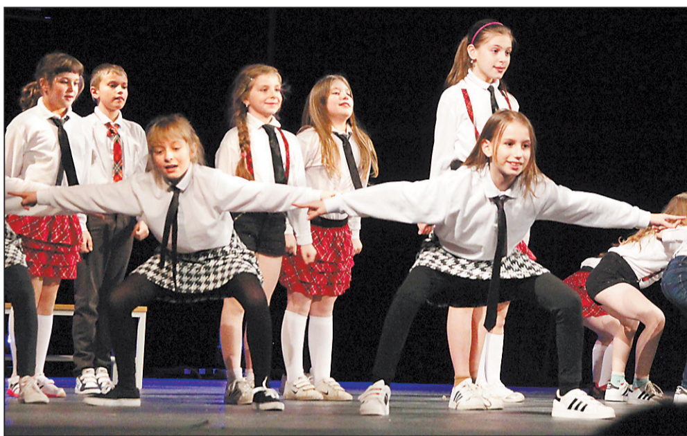
OMLADINA tanečního klubu Street Busters svým vystoupením zahájila galavečer Sportovec Jihlavska 2014.

O zpestření programu se svým vystoupením zasloužila zpěvačka Markéta Konvičková, show taneční skupiny Street Busters, mistryně ovládnutí BMX kola mistra světa Dominika Nekolného, vystoupení rokenrolové formace klubu Hotch Potch a vystoupení se švihadly v podání skupiny dívek Rope skipping ze Sokola Jihlava.