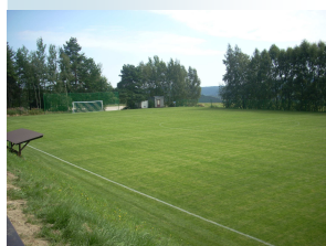
Nově rekonstruované hřiště v Cejli a pohled na původní pískové hřiště