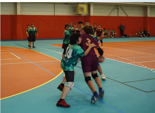
V nové hale předvedli své házenkářské umění dolnocerekevští žáci proti Dukle Praha

Páteční odpoledne 25. června 2010 znamenalo pro městyse Dolní Cerekev významnou sportovní událost - otevření nově zrekonstruované a kompletně přestavěné sportovní haly. Původní hala neodpovídala díky svým rozměrům požadavkům kladeným na současné nejvyšší házenkářské soutěže. Z tohoto důvodu se městyse rozhodl pro celkovou rekonstrukci haly, která stála téměř 12 mil. Kč. V pátek odpoledne byla celá etapa završena slavnostním otevřením. Ceremoniálu se zúčastnili mimo jiných významní hosté - hejtmán kraje Vysočina Jiří Běhounek, exposlanec Parlamentu ČR Vladimír Hink, zástupci dodavatelských firem, zástupce svazu házené Chvalný i zástupce ČSTV Vítězslav Holub.