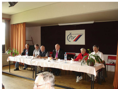
Fotografie z jednání 22. VH RS ČSTV Jihlava