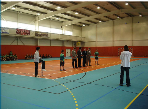
Chloubka městyse Dolní Cerekev — nová sportovní hala.