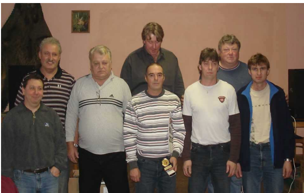
Ocenění funkcionářů TJ Podyjí Černíč